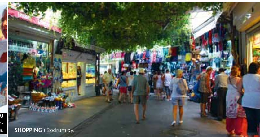
SHOPPING I Bodrum by.