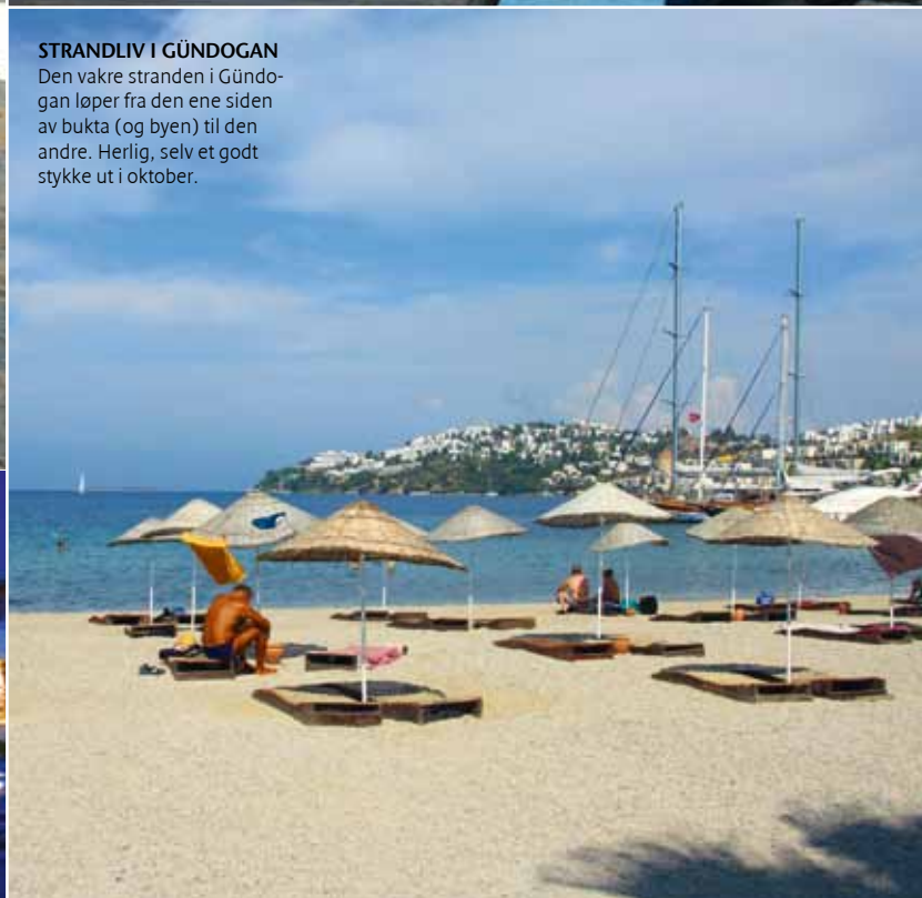
STRANDLIV I GÜNDOGAN Den vakre stranden i Gündogan løper fra den ene siden av bukta (og byen) til den andre. Herlig, selv et godt stykke ut i oktober.