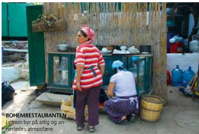
BOHEMRESTAURANTEN Lemon byr på artig og annerledes atmosfære.