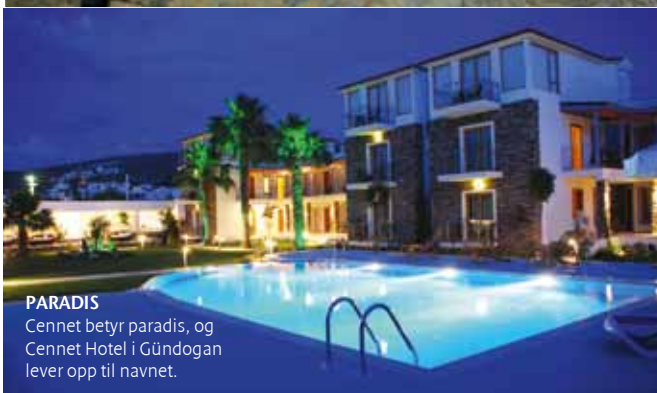
PARADIS Cennet betyr paradiset, og Cennet Hotel i Gündogan lever opp til navnet.

betyr "Paradis". Heldigvis et stykke fra TV3s Paradise Hotel, men likevel et treffende navn på stedet der jeg går rett fra rommet mitt og ut i Middelhavet.