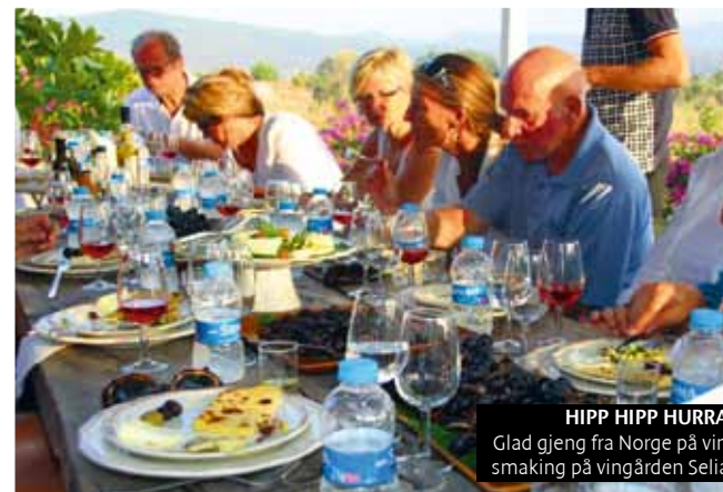
HIPP HIPP HURRA! Glad gjeng fra Norge på vinsmaking på vingården Selia.

Jeg booker meg inn på Cennet Hotel, som på tyrkisk