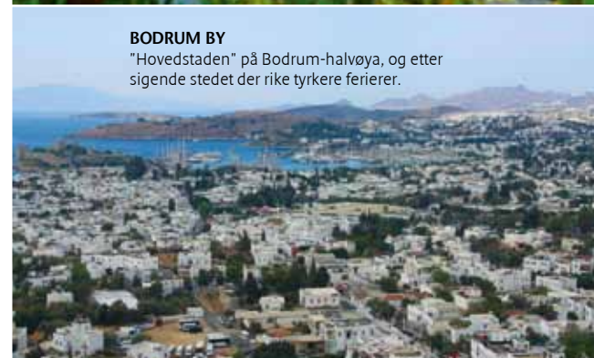
BODRUM BY "Hovedstaden" på Bodrum-halvøya, og etter sigende stedet der rike tyrkere ferierer.